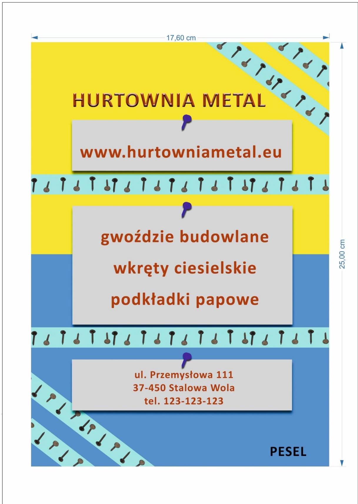
Rysunek 2. Wzór ulotki