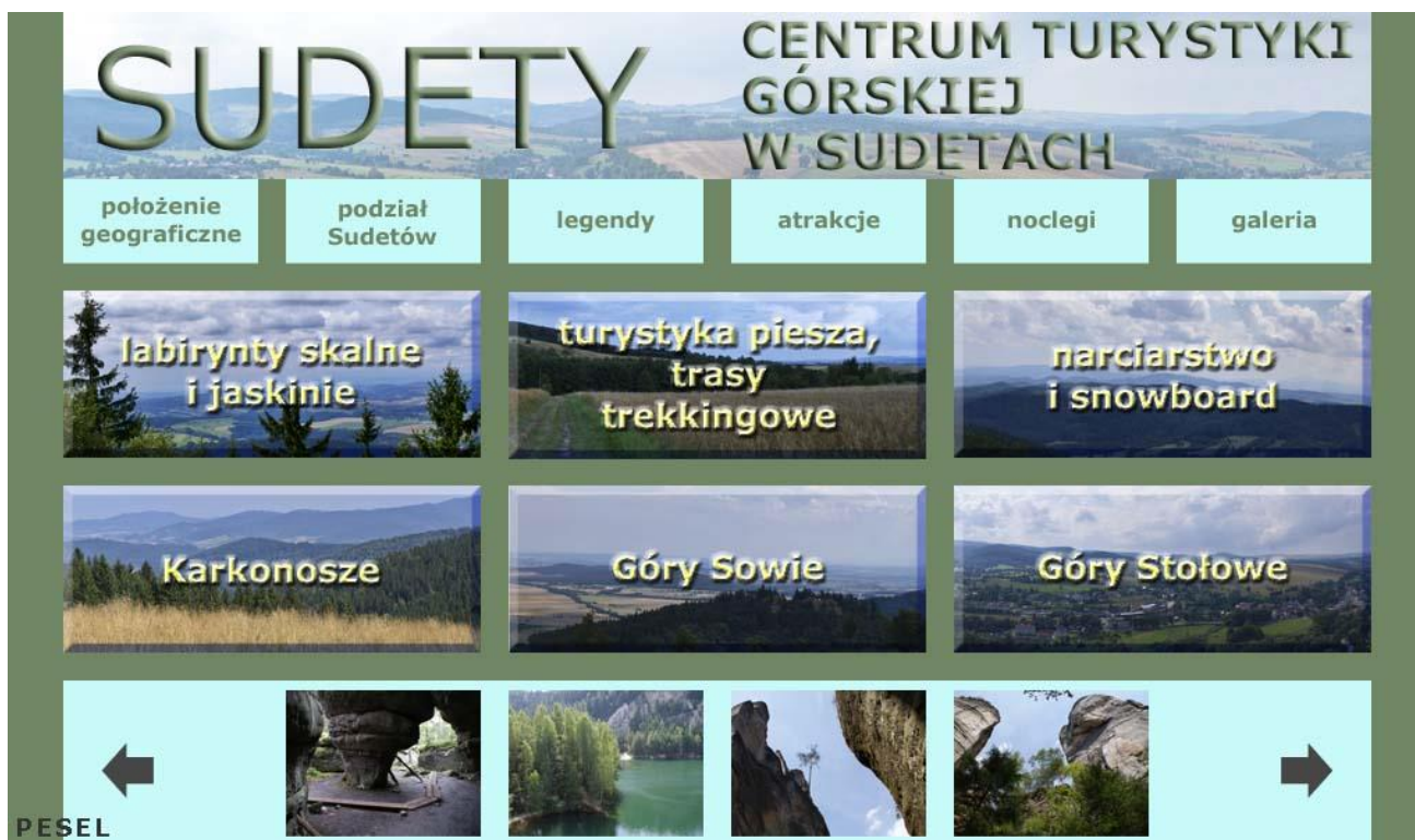
Rysunek 3. Wzór layoutu