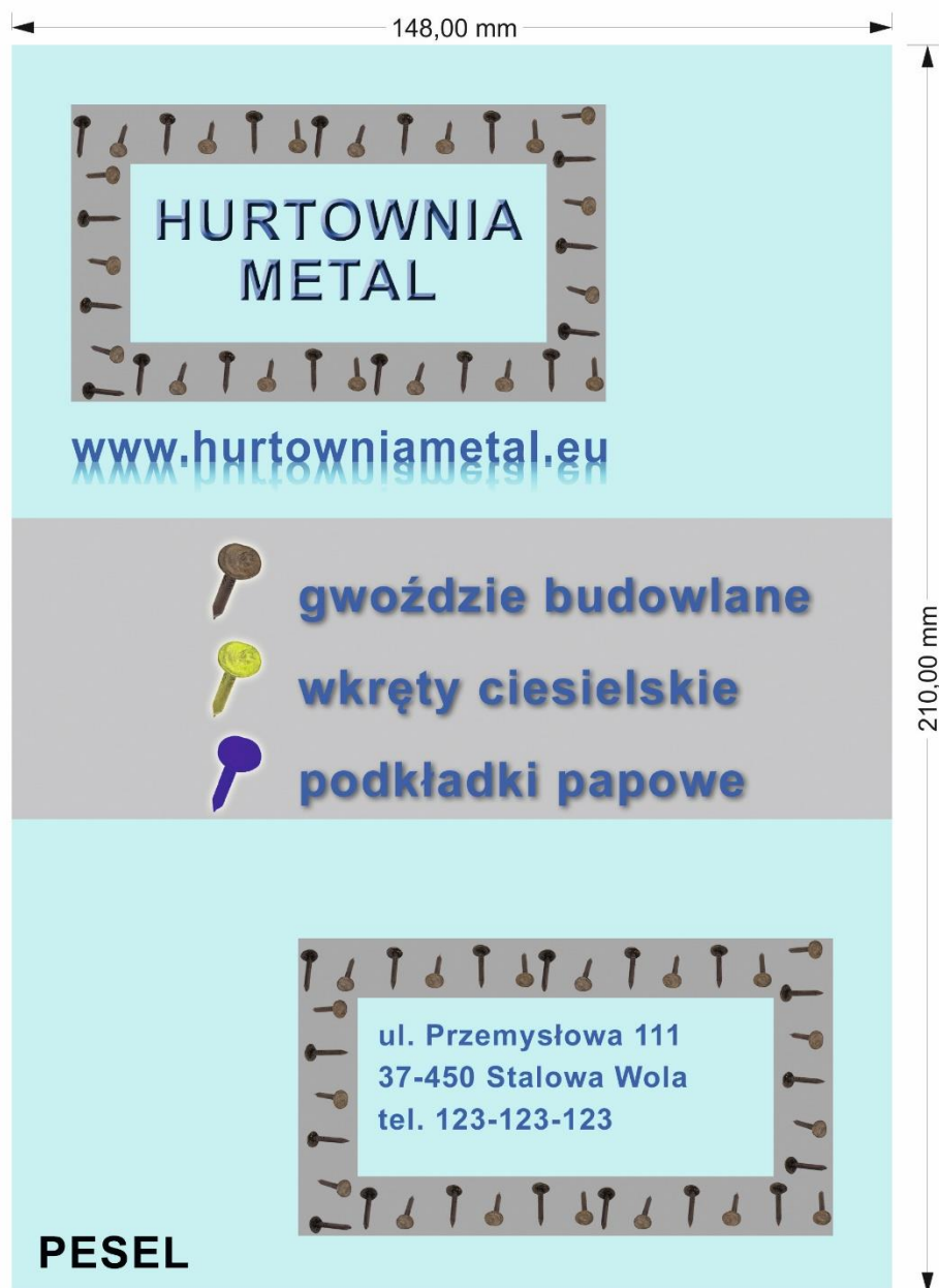
Rysunek 2. Wzór ulotki