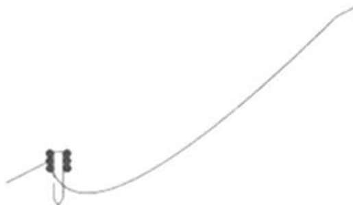
Etap 1 - wykonanie płotka z faszyny