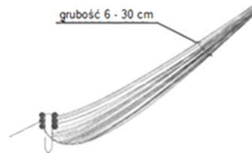
Etap 2 - rozłożenia ścieli z witek wierzbowych