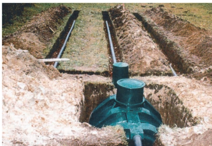
Rys. 3. Oczyszczalnia ścieków w trakcie wykonywania robót budowlanych

Uwaga! W Tabeli 2 zsumowane wyniki w wierszu „Razem” zaokrąglaj do pełnych metrów.