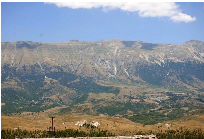
Rysunek 4. Wzór korekty zdjęcia