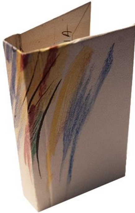
Rysunek 2. Wzór retuszu zdjęcia