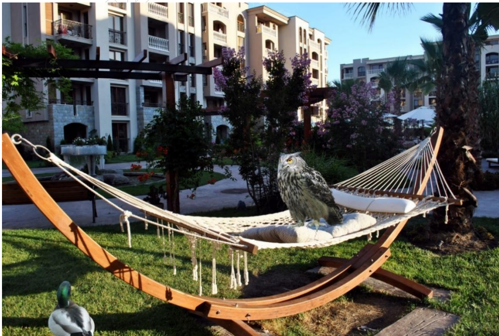
Rysunek 3. Fotomontaż