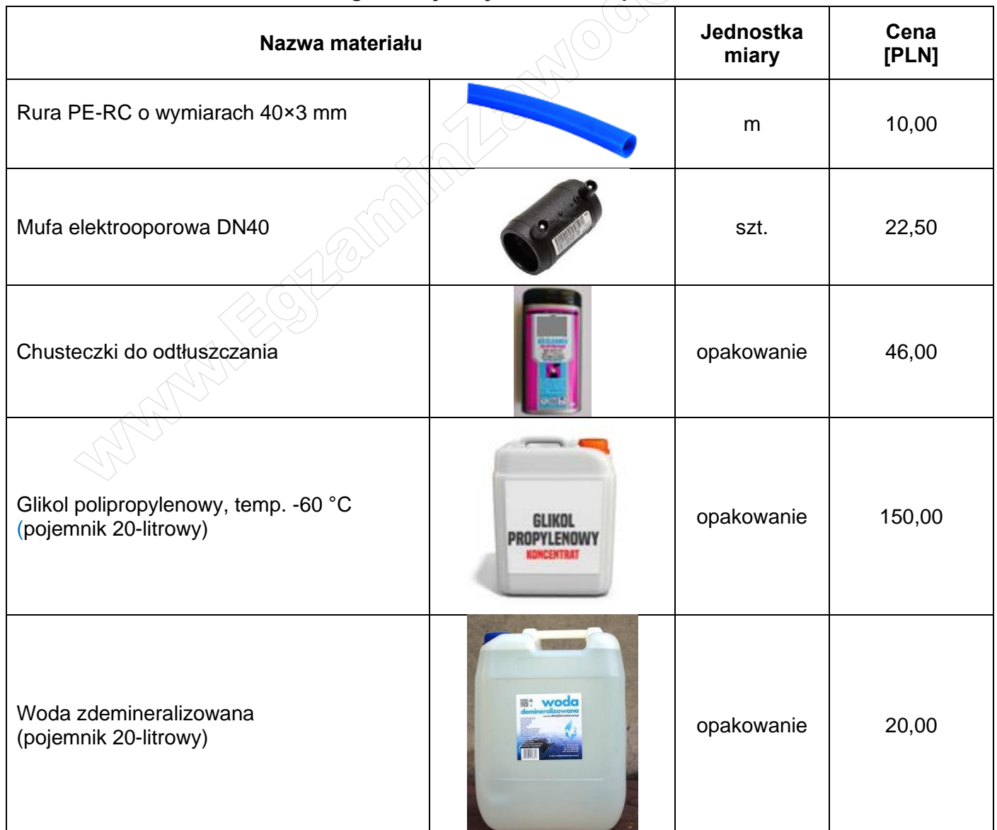
Tabela 3. Wykaz cen materiałów podczas wymiany pękniętej rury PE-RC w gruntowym wymienniku ciepła