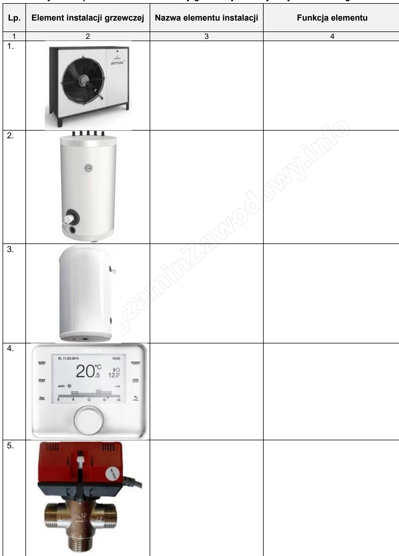
Tabela C. Wykaz urządzeń i elementów instalacji grzewczej dla budynku jednorodzinnego