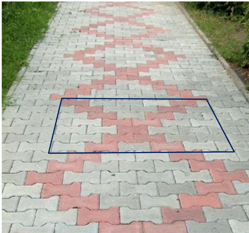
Rysunek 1. Nawierzchnia chodnika z zaznaczonym fragmentem wzoru

Po wykonaniu zadania oczyść używane narzędzia i uporządkuj stanowisko pracy.