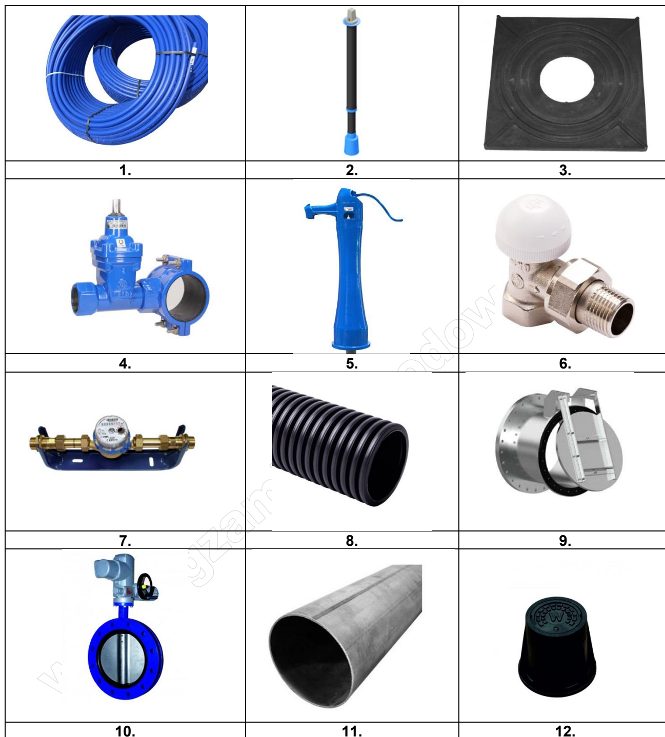
Tabela. 1. Zestawienie przewodów i armatury

Czas przeznaczony na rozwiązanie zadania wynosi 120 minut.