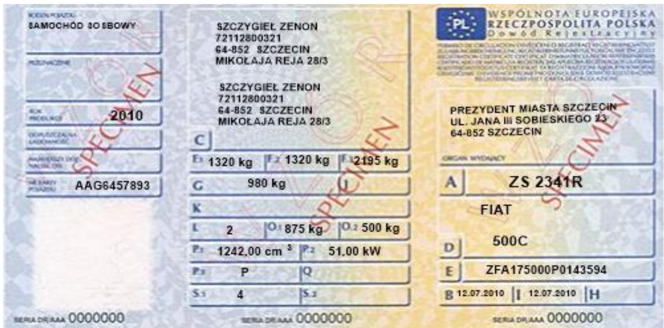
Rys. 1. Dowód rejestracyjny