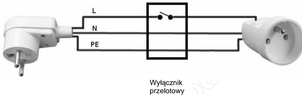
Rysunek 1. Schemat przedłużacza sieciowego z wyłącznikiem przelotowym

Stanowisko wspólne znajdujące się w sali egzaminacyjnej zostało wyposażone w lampę sollux. Zainstalowana lampa nie posiada wyłącznika sieciowego. Wykonaj kabel zasilający przedłużający oryginalny przewód zasilający lampę z wyłącznikiem, zgodnie ze schematem zamieszczonym na rysunku 1 . W tym celu wykorzystaj znajdujące się na stanowisku indywidualnym: wtyczkę sieciową, gniazdo, wyłącznik na przewód oraz przewód OMY 3 x 0,75 mm 2 . Na zakończeniach przewodów po stronie wtyczki i gniazda usuń izolację zewnętrzną kabla, oraz izolację na przewodach i zamontuj nieizolowane tulejki kablowe. W miejscu instalacji wyłącznika należy zdjąć izolację zewnętrzną kabla, przeciąć tylko przewód L, odizolować końcówki na przeciętym przewodzie, zamontować nieizolowane tulejki kablowe i zamocować wyłącznik. Zgodnie z ogólnie przyjętą zasadą, zastosuj odpowiedni kolor przewodu dla poszczególnych linii zasilających oraz ochronnej, a wyniki zanotuj w tabeli 1 .