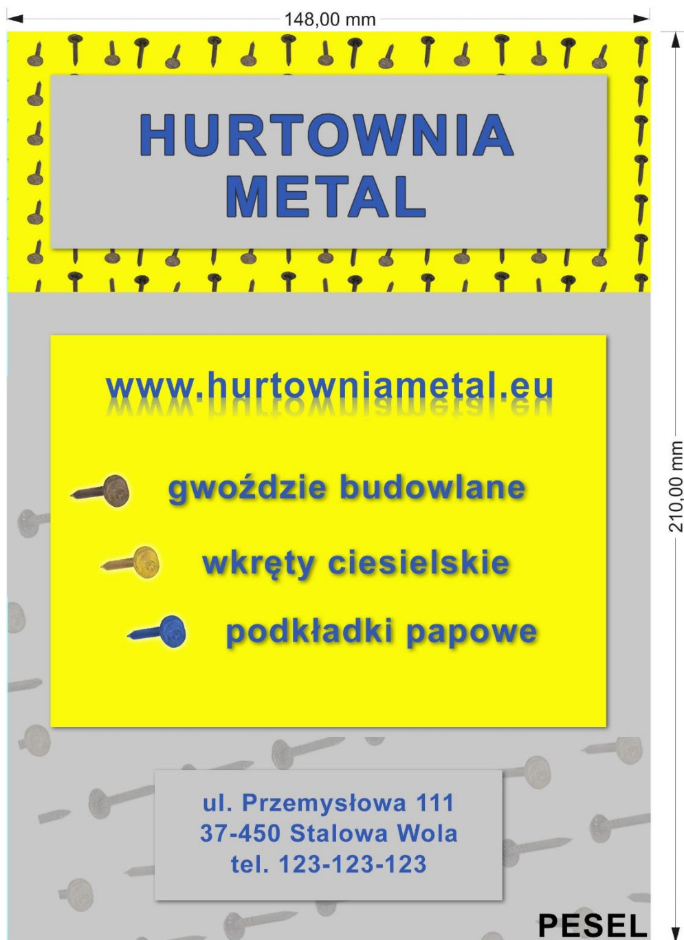
Rysunek 2. Wzór ulotki