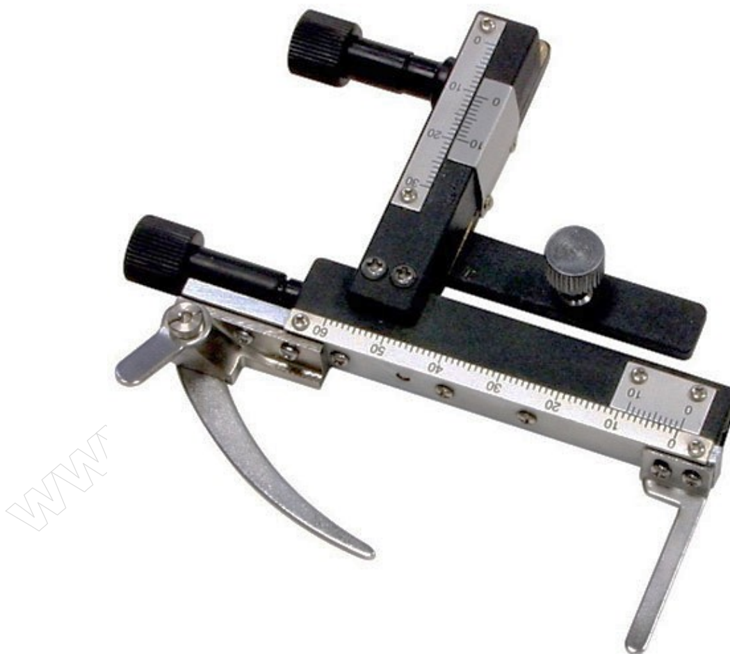
Rysunek 1. Nasadka krzyżowa do stolika mikroskopowego

Po wykonaniu zadania uporządkuj stanowisko pracy.