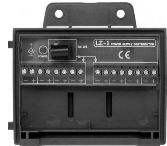
Rysunek 5. Widok wnętrza listwy zasilającej