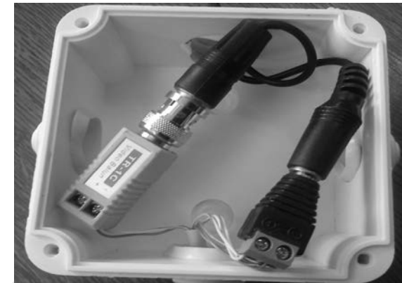
Rysunek 3. Połączenia w puszkach elektroinstalacyjnych